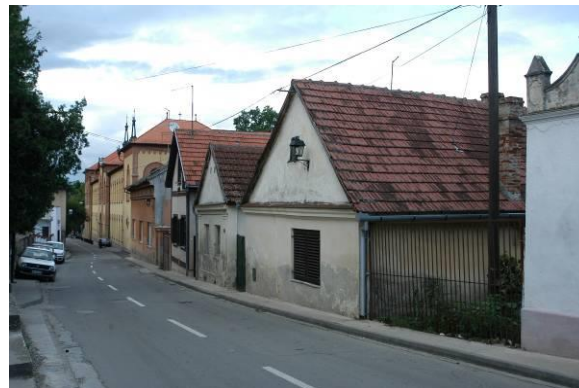
Сл. Бр. 42. Део улице где су биле две школе за време Максима Суворова и његовог брата Петра (Воросовачки сокак)