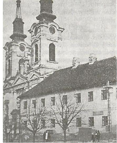
Сл. Бр.50. Нормална школа у којој је почела са радом Карловачка гимназија