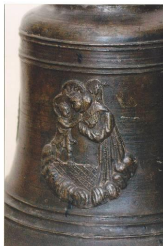
Сл.бр. 39: Школско звоно (1696. год.) и детаљ са звона

Прва школа имала је своју зграду која је била подигнута у XVII веку и до тада служила као језуитски манастир. Те 1713. год. претворена је у школу где се настава обављала током XVIII века и почетком XIX века. У архивским грађама нису сачувани драгоцени подаци о броју ученика у турско време, али сигурни смо да их није било много.