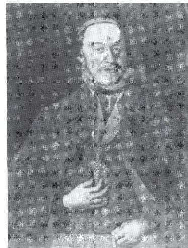
Сл. Бр. 47 Арсеније IV