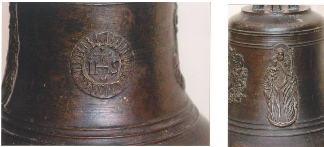
Сл.бр. 40: Детаљи са школског звона (1696. год.)